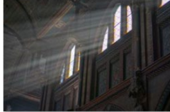
Nalatschappen beelden_BisdromRotterdam (5)