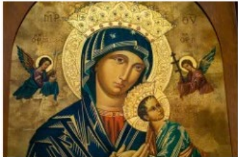
Nalatschappen beelden_BisdromRotterdam (7)

Gebruik de QR-code voor de brochure 'Nalaten aan het netwerk van liefde':