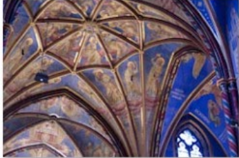
Nalatschappen beelden_BisdromRotterdam (4)