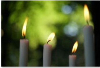
Nalatschappen beelden_BisdromRotterdam (1)

Heeft u zelf geen passende foto's dan zijn dit foto's die het bisdom voor u beschikbaar heeft: