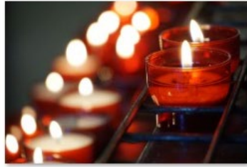
Nalatschappen beelden_BisdromRotterdam (2)