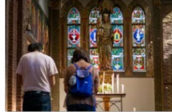
Nalatschappen beelden_BisdromRotterdam (6)